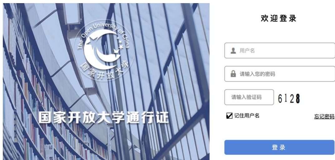
图 3 输入原学习网账户进行 VPN 认证并访问数字图书馆系统

需要远程访问的资源会提示您使用 VPN 进行访问，选择使用 VPN 后，请您使用原学习网的账户进行认证登录 VPN 后进行系统访问（图 3 所示）。