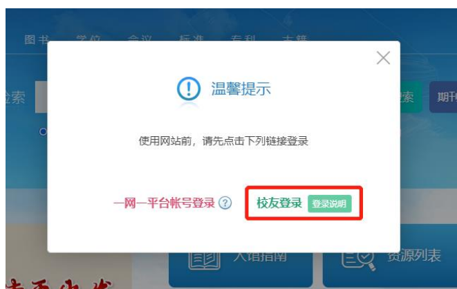
图 1 选择“校友登录”

如果您忘记了原来的账户，请致电 400-867-9660 进行查询（查询过程中选择“人工”）；如果您忘记了密码，请在登录页面选择“忘记密码”（ http://passport.ouchn.cn/Account/FindPassword ）进行重置。